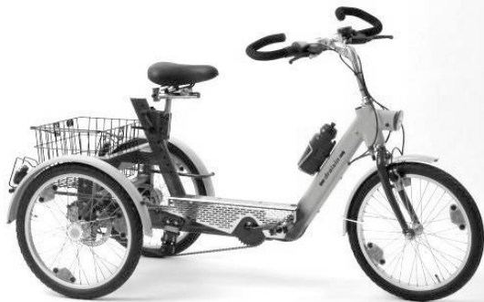
Abb. kann Sonderzubehör enthalten

Entwicklung, Produktion, Vertrieb von behinderten- und seniorengerechten Fahrrädern